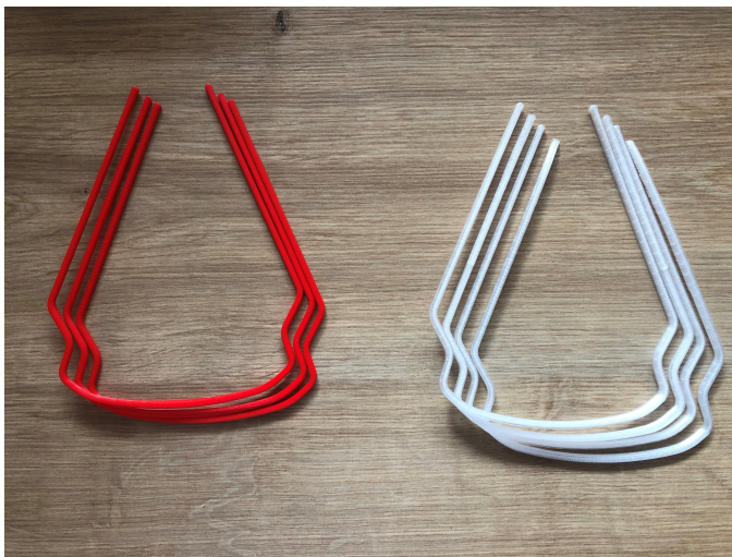
3D-Druck-Muster der Brillenbügel aus PLA und PC.

In Kliniken werden derzeit viele Gebrauchsmaterialien knapp, nicht nur Atemmasken. Schnelle Hilfe ist gefragt. Die Mannheimer Projektgruppe für Automatisierung in der Medizin und Biotechnologie PAMB, ein Ableger des Fraunhofer IPA, kennt die Probleme, denn sie hat täglich mit den Medizinerinnen zu tun. Ihr Arbeitsplatz liegt mitten auf dem Gelände der Mannheimer Uniklinik, direkt vor ihrem Fenster entstand ein Corona-Diagnosestützpunkt. Die Medizintechniker der Projektgruppe boten den Ärzten unbürokratisch ihre Hilfe an.